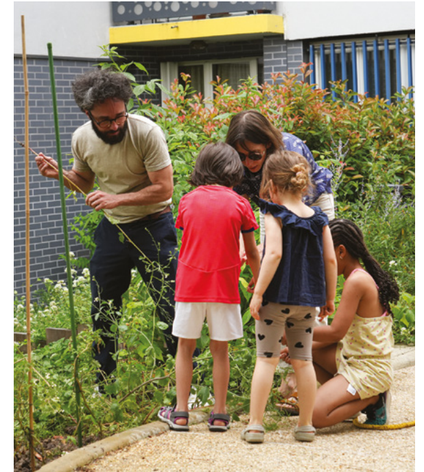
Résidence Cascades Paris 20 e , atelier jardinage organisé avec les locataires et l'association Vergers Urbains.

10 cellules de veille liées à la sécurité