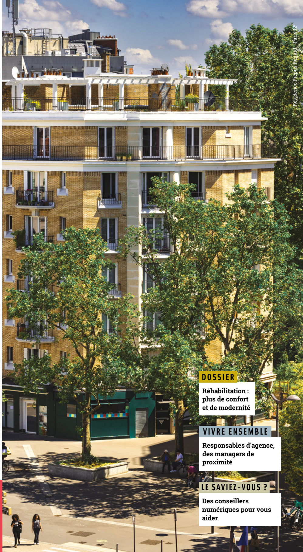
Residence Picpus Renard - Paris 12