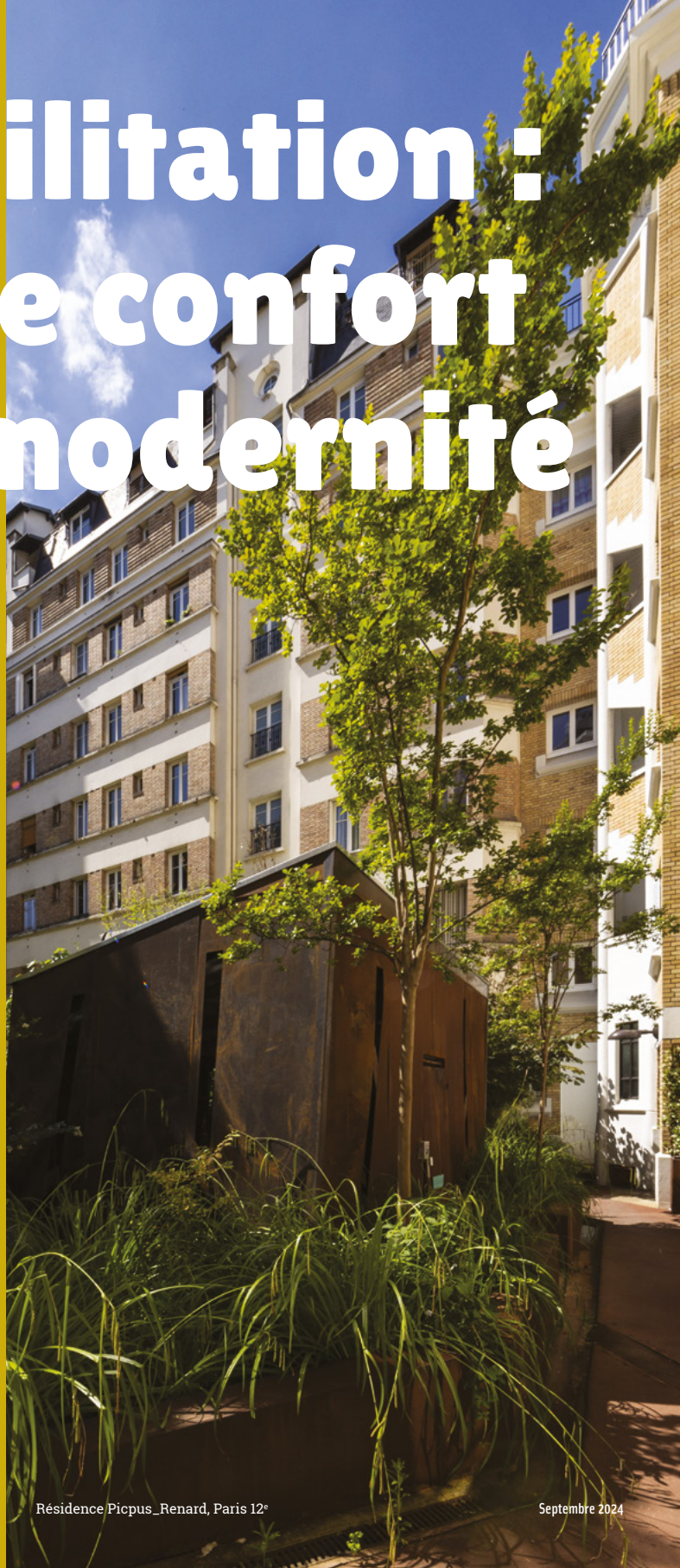
Résidence Picpus_Renard, Paris 12 e