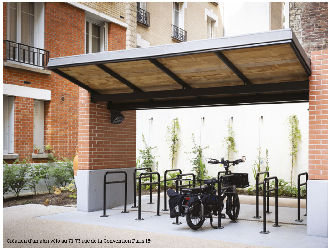
Création d'un abri vélo au 71-73 rue de la Convention Paris 15 e