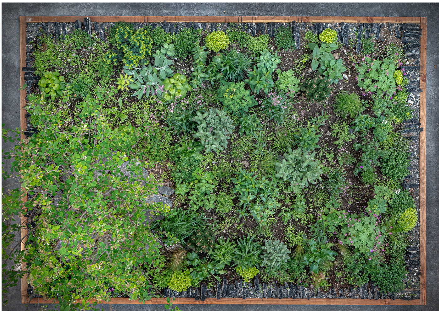
Premier jardin Asphalte, rue Carrière Mainguet, Paris 11