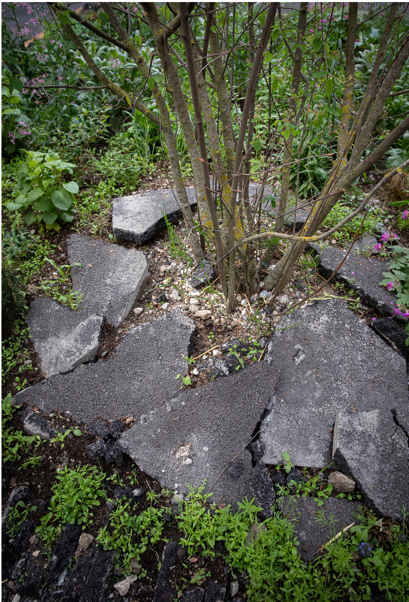
Premier jardin Asphalte, rue Carrière Mainguet, Paris 11 © Yann Monel