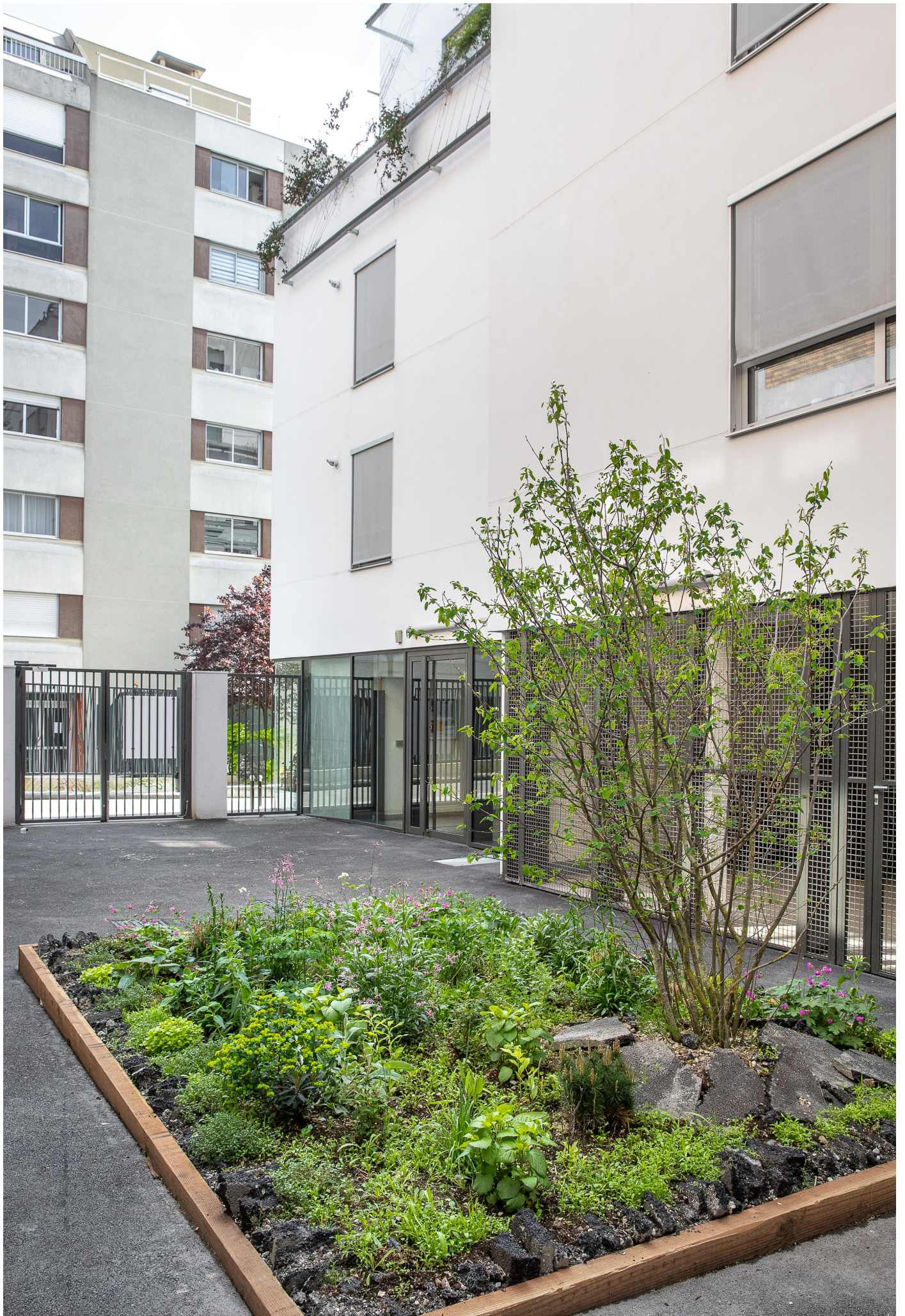
Premier jardin Asphalté, rue Carrière Mainguet, Paris 11