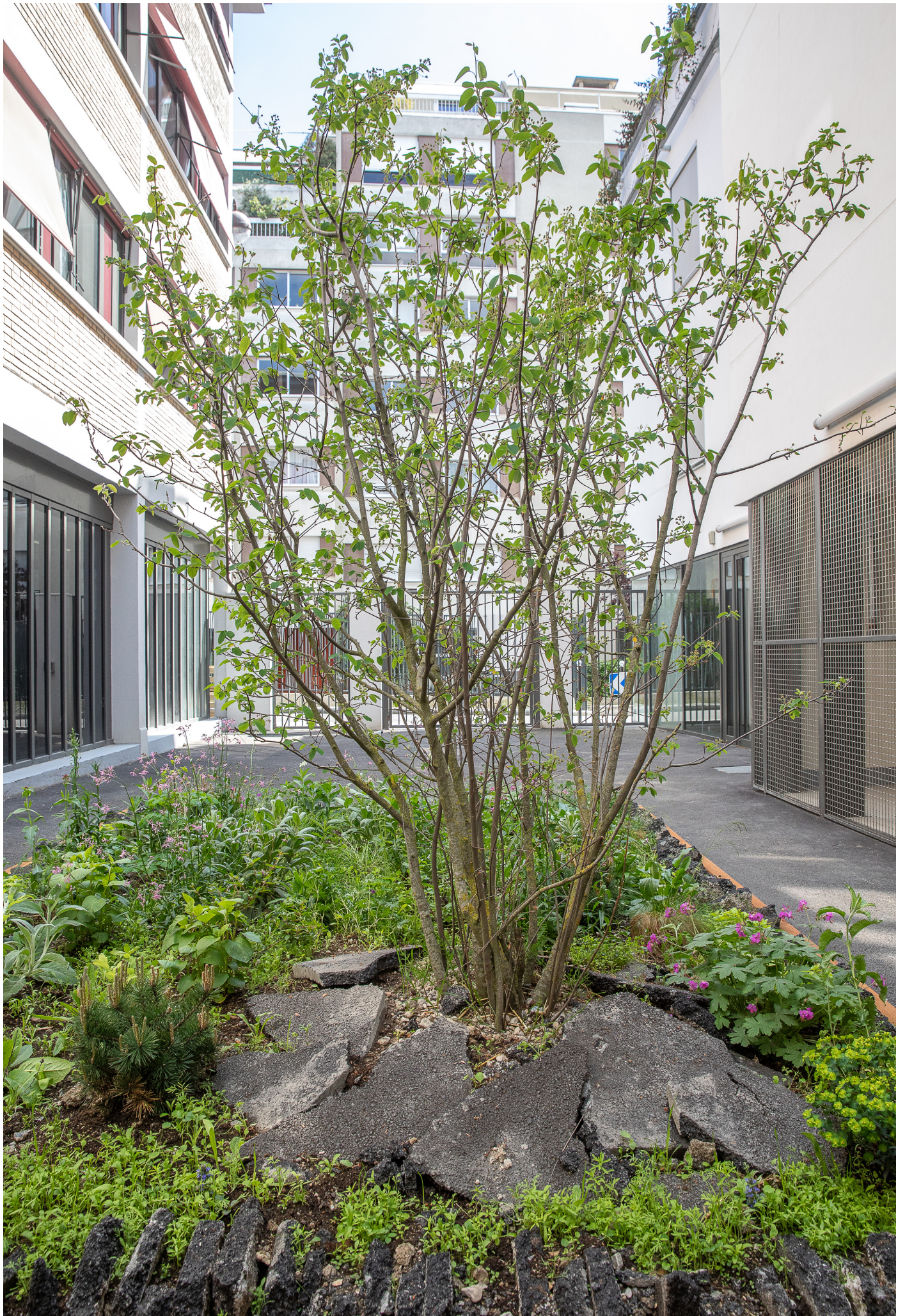
Premier jardin Asphalte, rue Carrière Mainguet, Paris 11