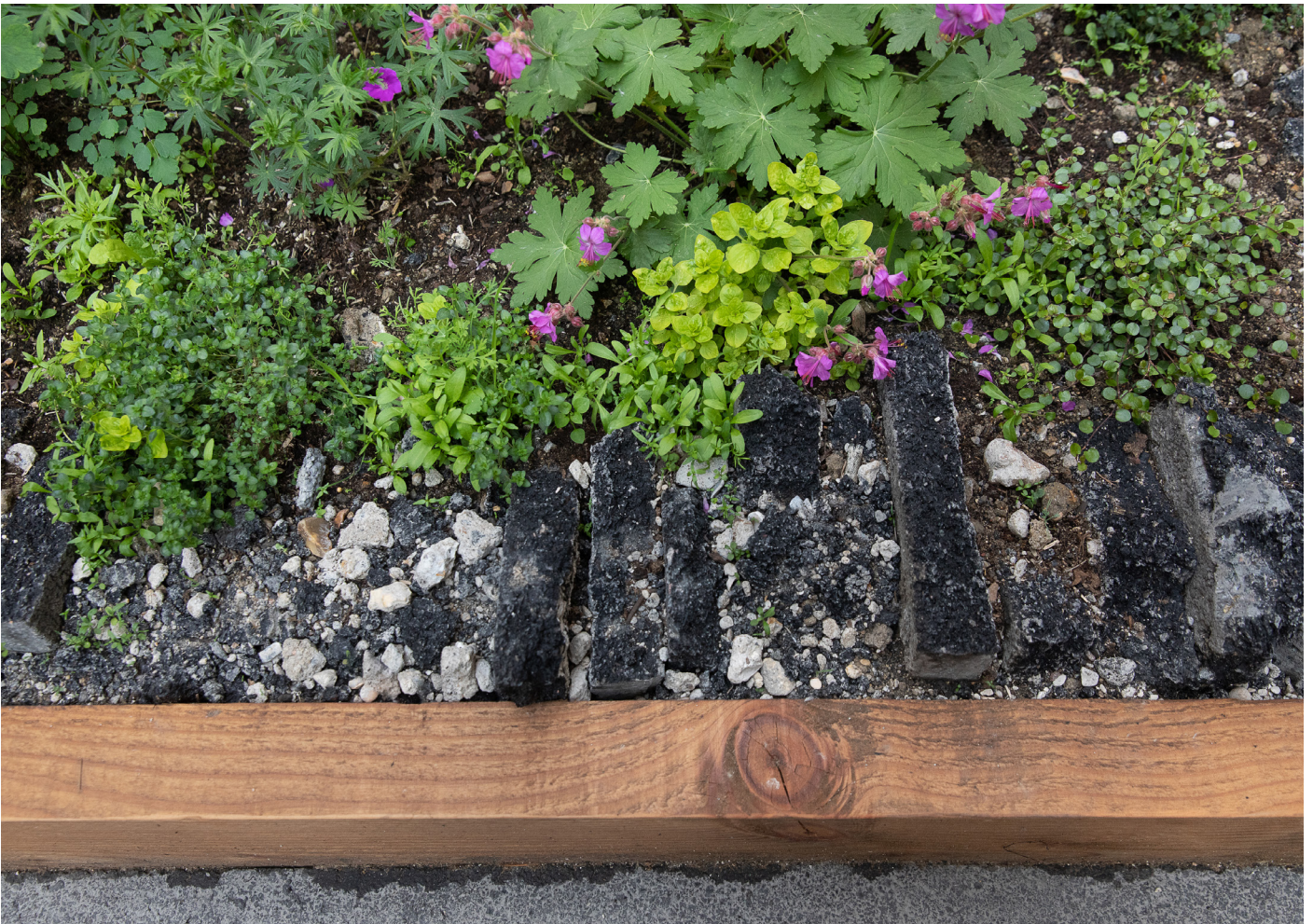
Premier jardin Asphalte, rue Carrière Mainguet, Paris 11